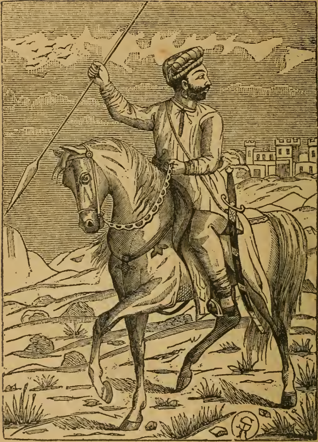
सुभेदार थोरले मल्हारराव होळकर.